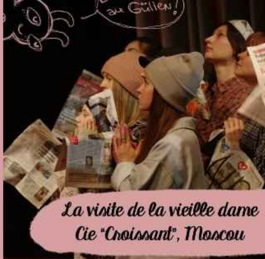
La visite de la vieille dame Cie "Croissant", Moscou

Le spectacle "la visite de la vieille dame" enchante et terrifie en même temps. Le jeu élégant des acteurs, la somptuosité des costumes, les métaphores subtiles de la mise en scène, la langue française impeccable, tout cela ne peut procurer que du plaisir. Mais le ravissement se mue en honneur quand devient claire l'idée du spectacle. L'argent résout tout. A cause de ces petits papiers, les gens sont prêts à descendre à n'importe quelle bassesse. La vie humaine devient sans valeur, par rapport aux biens matériels.